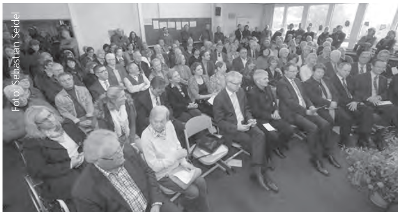
Zahlreiche Gäste füllten den Saal bei der Wiedereröffnung des DDR-Museums in Pforzheim.

Museum verändert. Wir haben es neu aufgestellt, und wir sind ziemlich sicher, daß wir in seinem Sinne gehandelt haben.“ Die alte Ausstellung sei nicht verändert worden, weil sie schlecht war, sondern weil sich die Auffassungsbereitschaft junger Menschen verändert habe. Enzyklopädisches Wissen suchten junge Leute nicht mehr im Brockhaus oder im Museum, sie fänden, was sie suchten, im Internet. Das Museum solle nicht nur für Ältere attraktiv sein, sondern besonders auch für Jugendliche. Klaus Knabes Museum solle der Jugend den Unterschied zwischen Diktatur und Demokratie aufzeigen. Sie sollten daran erinnert werden, wie stark Rechtsstaatlichkeit, Freiheit und Demokratie heute ihr Leben bestimmten.