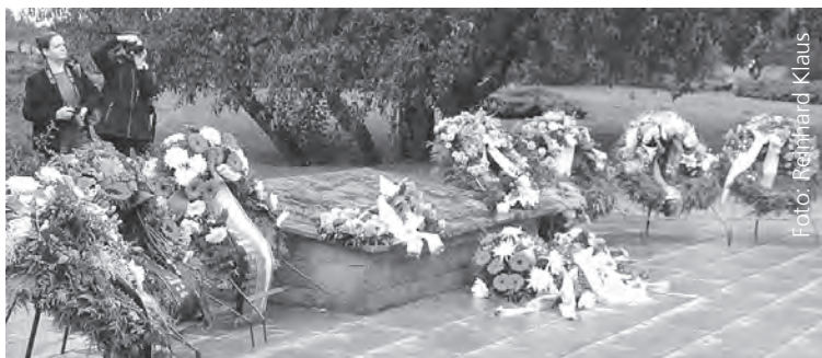
Gedenken ohne Namen? Nach der Kranzniederlegung am Massengrab Sachsenhausener Speziallager-Häftlinge auf dem ehemaligen Kommandantenhof im September 2015.