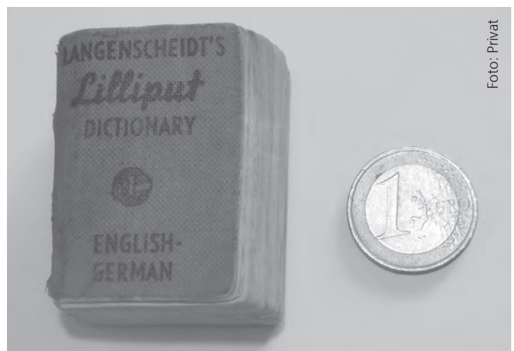
Ein Englisch-Wörterbuch im Liliput-Format.

Trotz allem: Mein illegal erlerntes Englisch hat mir drei Monate nach dem Freikauf durch die Bundesrepublik bei der Fremdenprüfung zur Erlangung des Abschlußzeugnisses einer Realschule insoweit geholfen, als ich diese Prüfung bestand (Englisch war eines der Hauptfächer), und damit ein Jahr später ein Ingenieurstudium an einer Aachener Fachhochschule aufnehmen konnte.