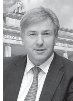
Klaus Wowereit – Der Regierende Bürger- meister von Berlin

Klaus Wowereit Der Regierende Bürgermeister von Berlin