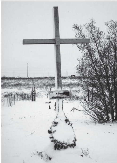
Kreuz für die Toten des Streiks 1953 in Workuta. (Foto: Lothar Scholz, November 2003)

Es war die Frage zu klären, ob die Gräber der Opfer der kommunistischen Gewaltherrschaft, darunter besonders die Massengräber, unter diejenigen Bestimmungen der Länder und des Bundes fielen, wie sie den Opfern des Nationalsozialismus zugestanden worden waren: danach hatten die Opfer von Krieg und Gewaltherrschaft ein „dauerndes Ruherecht“. Ob und wie weit dieses Recht in allen Einzelfällen auch den Opfern in der SBZ/DDR zugesprochen werden sollte, musste eigens festgestellt und verordnet werden. Erst nach diesem juristischen Akt konnten diese Gräber auf Dauer gesichert und Konzeptionen für das Gedenken entworfen werden.