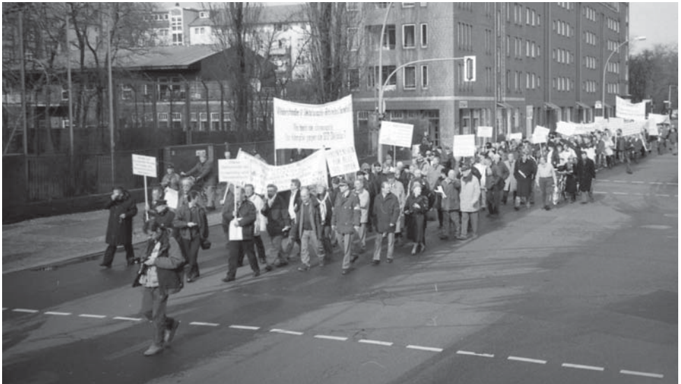
Demonstration für Ehrenpensionen und Anerkennung von Haftfolgeschäden im Frühjahr 2007.

Die UOKG hatte stets dafür geworben, denjenigen Menschen, die aus politischen Gründen zu Opfern geworden waren, unabhängig von Schäden eine Ehrenpension zuzugestehen. Als sich abzeichnete, dass diese Forderung auf absehbare Zeit nicht durchzusetzen war, musste sich die UOKG der aktuellen Entschädigungspraxis zuwenden und dort möglichst Erleichterungen für die Opfer erstreiten sowie für das Beratungsnetz der Verbände günstige politische Rahmenbedingungen schaffen.