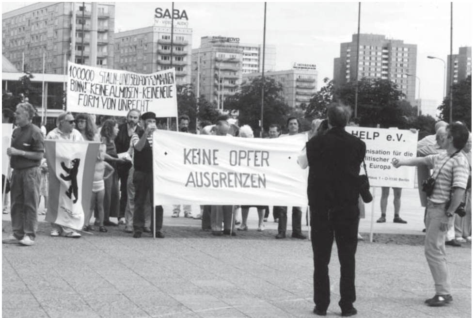
Demonstration der Opferverbände in Berlin für gerechte Entschädigungsleistungen am 15. Juni 1992.

Im Februar 1992 beschwerte sich die UOKG in einem Schreiben an die Berliner Justizsenatorin Limbach über die weitgehend pauschale weitere Zulassung von Rechtsanwälten aus der DDR. Der Senat berief sich – zu Recht – auf den Einigungsvertrag, nach dem eine inhaltliche Prüfung der früher in der DDR erteilten Zulassung nicht vorgesehen war. Angekündigt wurde allerdings ein neues Gesetz, nach dem eine nachträgliche Überprüfung der Rechtsanwälte ermöglicht werden sollte. 99 Ehemalige Häftlinge und andere Opfer der DDR mussten nun regelmäßig selbst prüfen, ob sie nicht einen Rechtsanwalt mit ihrer Sache beauftragten, der selbst seine Vergangenheit vertuschen musste. Dem Ansehen dieses Berufsstandes hat die weitgehend ungeprüfte Übernahme der DDR-Rechtsanwälte geschadet.