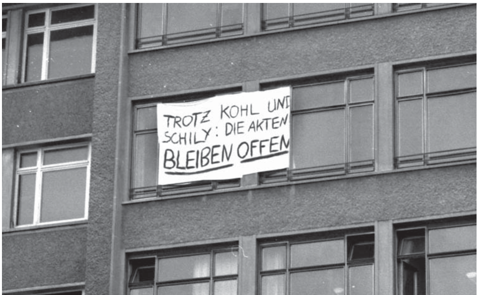
Plakat am ehemaligen Hauptgebäude des MfS in der Ruschestraße, dem Sitz mehrerer Verbände (um 2001).

Mit dem deutschen Einigungsvertrag vom 31. August 1990 waren die Unterlagen des MfS zunächst gesperrt und konnten nur für wenige, unaufschiebbare Fälle eingesehen werden. Eine allgemeine Akteneinsicht der bespitzelten Bürger war nicht vorgesehen. 75 Am 4. September 1990 besetzten 21 Bürgerrechtler die Räume der MfS-Zentrale in Berlin und forderten, das Gesetz vom 24.8. zum Bestandteil des Einigungsvertrages zu erklären. Eine von dem damaligen Innenminister Diestel befohlene Räumung durch die Polizei wurde durch Intervention der Volkskammerpräsidentin Bergmann-Pohl verhindert. Die Bürgerrechtler erhielten Unterstützung durch den Abgeordneten der Volkskammer Wolfgang Ullmann. 76 Wegen der anhaltenden Kritik an Innenminister Diestel wurde dieser am 14. September 1990 von der Auflösung der Staatssicherheit entbunden. Am 18. September wurde zwischen den Regierungen der Bundesrepublik und der DDR vereinbart, ein gesamtdeutsches Gesetz zu erlassen, das eine umfassende Aufarbeitung der Hinterlas-