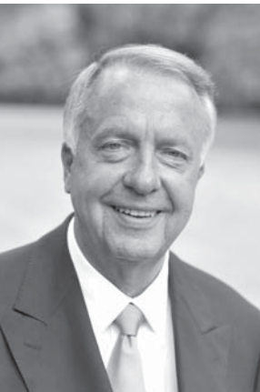
Staatsminister Bernd Neumann

Der Union der Opferverbände Kommunistischer Gewaltherrschaft kommt bei der Aufarbeitung des unter der SED-Diktatur geschehenen Unrechts und der Erinnerung an das Schicksal der Opfer eine herausragende Rolle zu. Die in ihr zusammengeschlossenen Verbände geben den Opfern Raum, um sich gegenseitig auszutauschen, gemeinsam zu erinnern, zu gedenken und sich für Rehabilitation und Entschädigung einzusetzen. Damit wird auch die Möglichkeit geboten, ein Stück der durch die kommunistische Diktatur zerstörten menschlichen Würde wiederzugewinnen. Nicht zuletzt dem hohen ehrenamtlichen Engagement der Mitglieder ist es zu verdanken, dass die Geschichte der