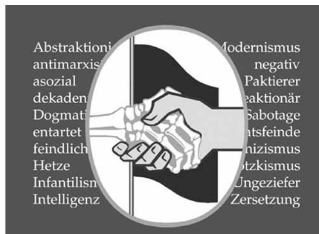
Umschlagbild der „giftigen Worte“.