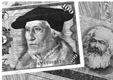
Von Marx aus dem Osten zu Münster in den Westen.

Aufmerksam verfolgte die SED/PDS den Untersuchungsausschuß der Volkskammer zur Überprüfung von Amtsmißbrauch und Korruption, dessen Installation den Willen der SED/PDS und der ihr einst verbundenen Blockparteien zur Veränderung unter Beweis stellen sollte. Daß der ehe-