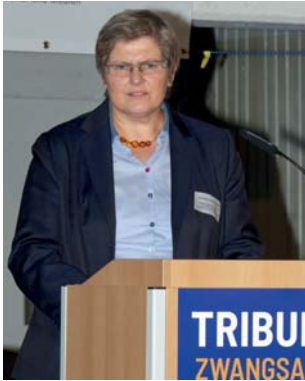
Birgit Neumann-Becker, Die Beauftragte des Landes Sachsen-Anhalt zur Aufarbeitung der SED-Diktatur