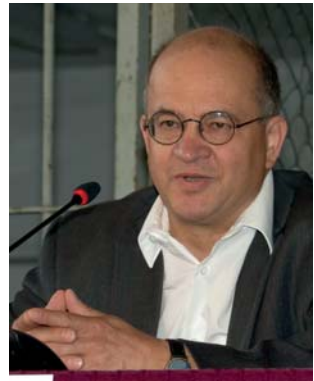
Arnold Vaatz, MdB

Als letztes freue ich mich besonders, Ihnen Herrn Arnold Vaatz vorstellen zu können. Er ist stellvertretender Vorsitzender der CDU/CSU-Fraktion im Deutsche Bundestag und ehemaliger DDR-Bürgerrechtler.