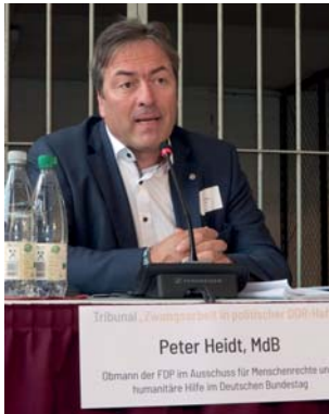
Peter Heidt, MdB

Obmann der FDP-Bundestagsfraktion im Ausschuss für Menschenrechte und humanitäre Hilfe im Deutschen Bundestag