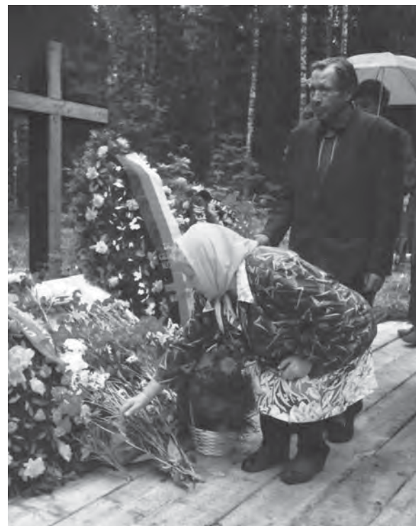
Zur Einweihung 1998 kamen auch einige alte Dorfbewohner, die sich noch an das Lager erinnerten.