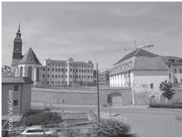
Zuchthaus Waldheim, Blick von Südosten 2011.

Im Juni 1850 hielt im Morgengrauen auf einer Anhöhe vor Waldheim in Sachsen eine mit Pferden bespannte Kutsche, in der der Revolutionär August Röckel (1814–1876) saß. Er war wegen Beteiligung am Dresdner Mai-Aufstand 1849 zunächst zum Tode verurteilt worden, hatte ein reichliches Jahr auf der Festung