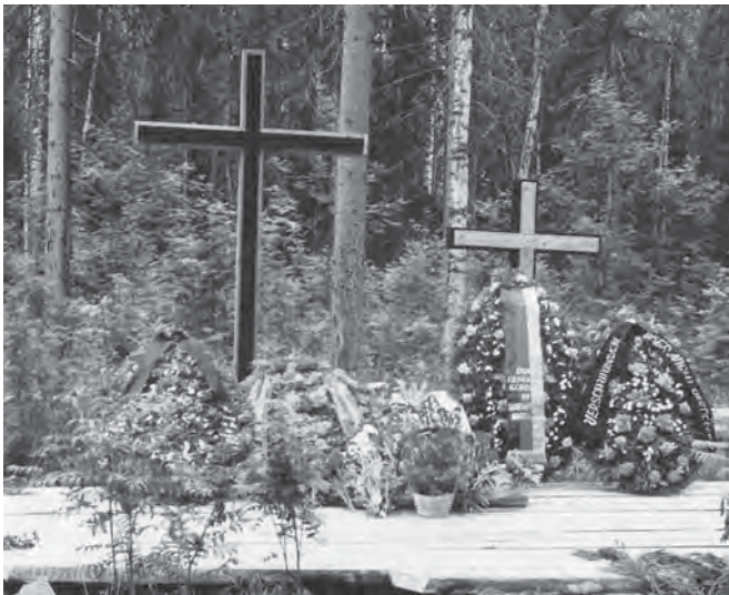
Spätes Gedenken auf den Gräbern.

Und wirklich, am 16. Juni war der Kanal fertig, das Band wurde zerschnitten, der erste Dampfer fuhr durch, und drei, vier Tage später begann die Durchfahrt der Schiffe, die in Deutschland beschlagnahmt worden waren, nach Norden. Es waren über 400. Einige nahmen an, daß man die Schiffe nach Murmansk nicht hätte an Frankreich und England vorbei überführen können, und allein diese Überführung rechtfertigte den Bau des Kanals. Im Juli waren alle Formalitäten abgeschlossen, die mit der Übergabe des Kanals verbunden waren und unser ganzes Kollektiv bekam eine neue Verwendung. Wir fuhren nach Leningrad und bauten dort einen neuen Rüstungsbetrieb. Mit uns fuhr meine deutsche Brigade. Ihre