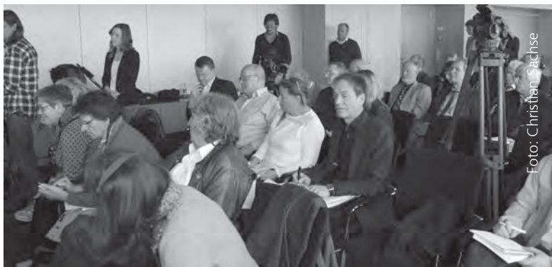
Großes Interesse an den Forschungsergebnissen zur Zwangsarbeit bei der Deutschen Reichsbahn der DDR.