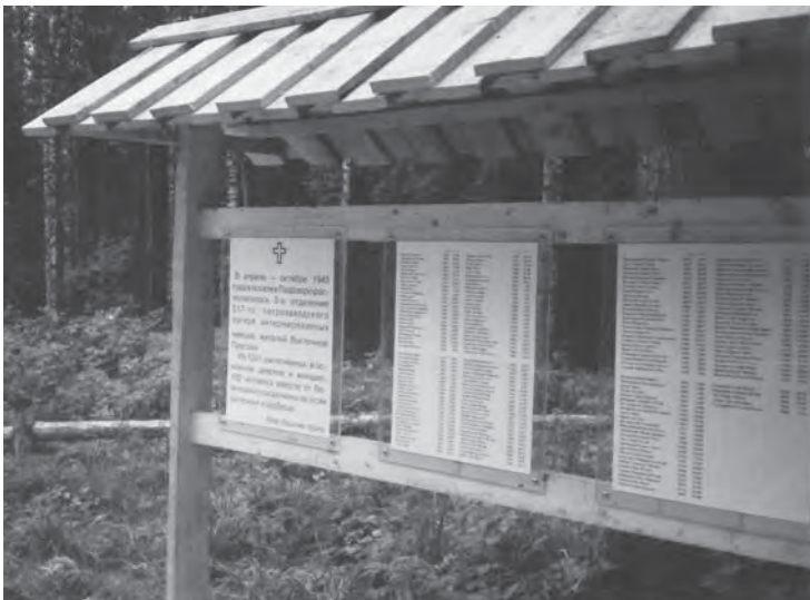
Die Namen der Toten des Lagers 517 in Padosero sind am Gedenkort bei den Massengräbern zu lesen.

Das Sammeln von Pilzen und Beeren war kein Einfall der Leitung des Lagers 517. Am 20. und 21. Juni 1945 hat das NKWD der UdSSR zwei Anweisungen – Nr. 129 und Nr. 133 – herausgegeben, in denen es heißt, daß „das Gemüse und die Kartoffeln aus der Ernte 1944, die für die Kriegsgefangenen und Interniertenlager