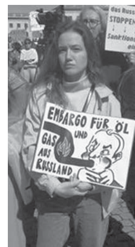
Impressionen von der Kundgebung,