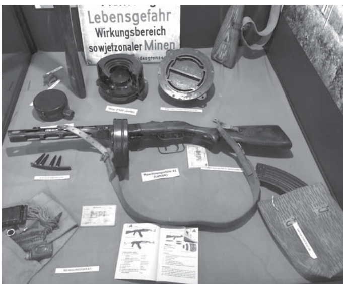
DDR-Gewehr, Munition und Minen, im Grenzland-Museum Schnackenburg ausgestellt