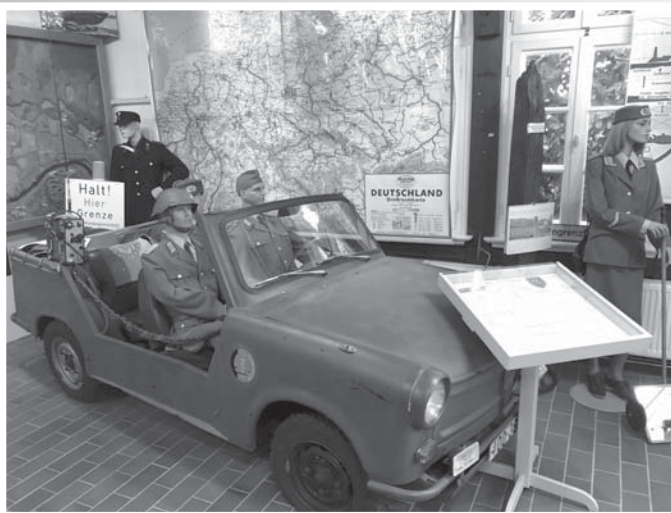
DDR-Grenzauto „Trabant“ im Museum Schnackenburg