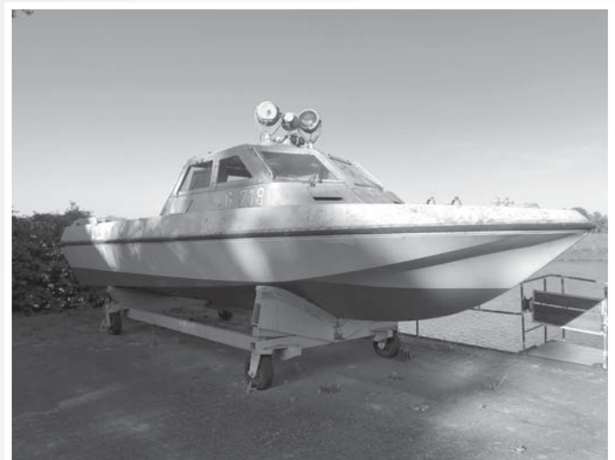
DDR-Grenzboot von der Elbe. Mit so einem Boot wurde Lemme durch eine Schiffsschraube getötet