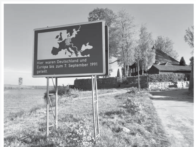
Schild am Elbufer in Schnackenburg zum Ende der deutschen Teilung mit dem Datum genau hier