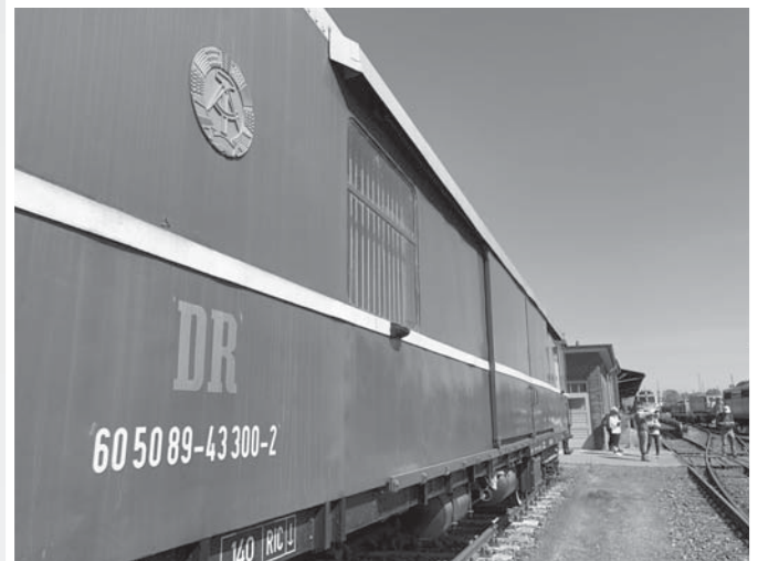
Der frühere Waggon von Walter Ulbricht für seinen Tschaika am Bahnhof von Wittenberge