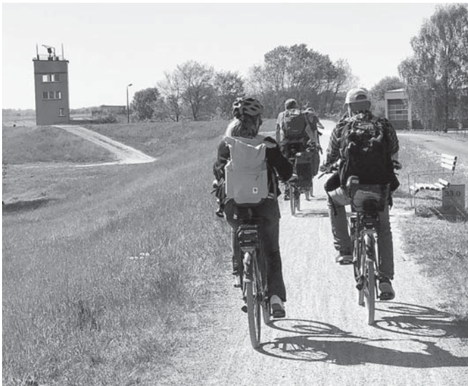
Der Grenzturn Cumlosen am Elbdeich