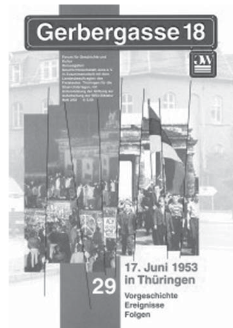
Gerbergasse 18, Heft 29

Die Geschichtswerkstatt veröffentlichte zum 60. Jahrestag des 17. Juni 1953 das Heft 29 (Ausgabe 2/2003) der „Gerbergasse 18“ mit dem Thema „17. Juni 1953 in Thüringen. Vorgeschichte, Ereignisse, Folgen“.