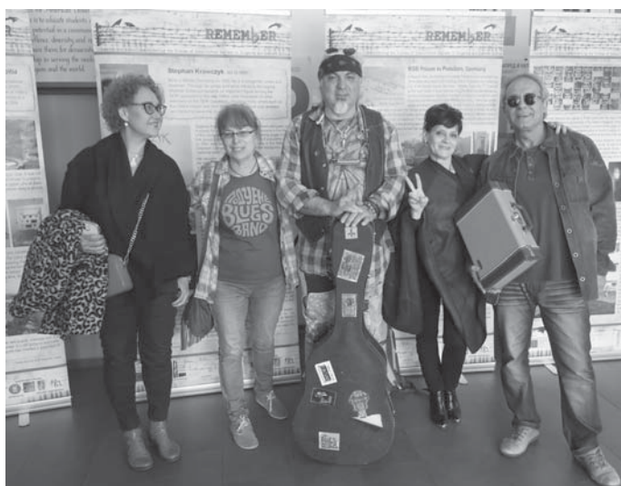
Der bulgarische Blues-Musiker Vasko – Band vor Bannern der Ausstellung: Verbotene Musik während der Zeit des Kommunismus