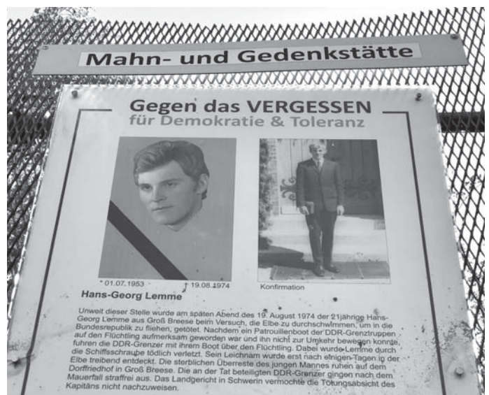
Gedenktafel für Lemme am Ufer der Elbe

tet. Am Gebäude listet eine Tafel alle 26 Grenztoten der Region und die Umstände ihres Todes auf. Schicksale, die einen noch heute schaudern lassen.