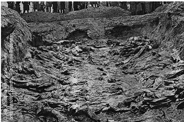
Eines der Massengräber in Katyn. Aufnahme von 1943.

Das Verbrechen von Katyn besteht nicht nur aus dem Mord an den 22 000 polnischen Bürgern im Frühjahr 1940. Es besteht in einem halben Jahrhundert Lüge und Fälschungen, in dem die Sowjetunion entgegen offensichtlicher Tatsachen ihre Verantwortung für die Vernichtung der polnischen Kriegsgefangenen geleugnet und versucht hat, die ganze Welt und die