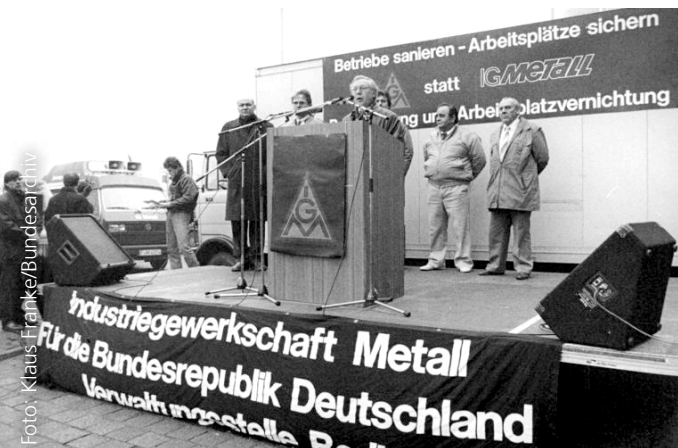
Am 28.11.1990 fordern rund 2000 Beschäftigte der Metall- und Elektroindustrie aus Berlin und Brandenburg die Sanierung der Betriebe und den Erhalt ihrer Arbeitsplätze.

Ist die Geschichte der Treuhand nun eine Geschichte des Scheiterns oder des Erfolgs? Die blühenden Landschaften hat sie während ihres Bestehens sicher nicht im Osten geschaffen. Ihre Tätigkeit war häufig für die Betroffenen schmerzlich und existentiell einschneidend. Mancher Schaden hätte vermieden werden können. Doch der brachiale Umbau einer Planwirtschaft zur Marktwirtschaft hat zumindest dafür gesorgt, daß in Deutschlands Osten heute nicht eine riesige Ansammlung von Staatsbetrieben am Subventionstropf dahinvegetiert. Das ist eine Basis für die Zukunft. Und die theoretischen Arbeiten, von denen Lothar de Maizière sprach, in denen steht, was man hätte bessermachen können, haben auch ihren Sinn. Vielleicht helfen sie Ländern wie Kuba und Nordkorea in einigen Jahren, die Fehler der Deutschen nicht zu wiederholen.