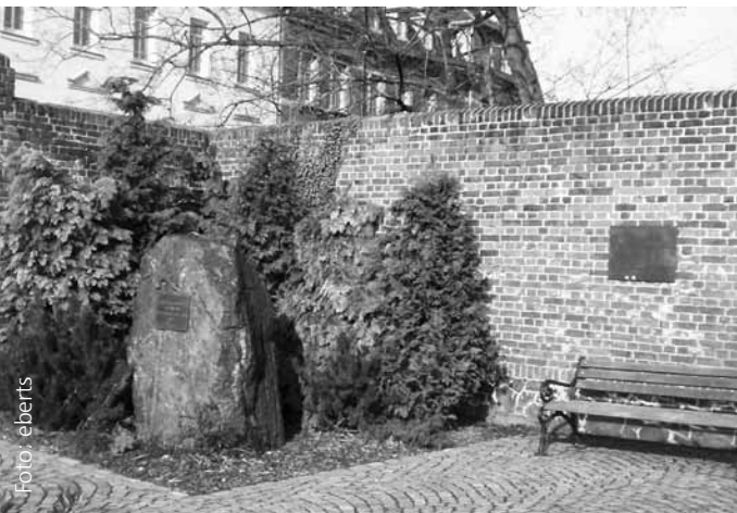
Gedenkstein und Gedenktafel auf dem Gelände des ehemaligen Zuchthauses Waldheim für die Opfer der Waldheimer Prozesse.