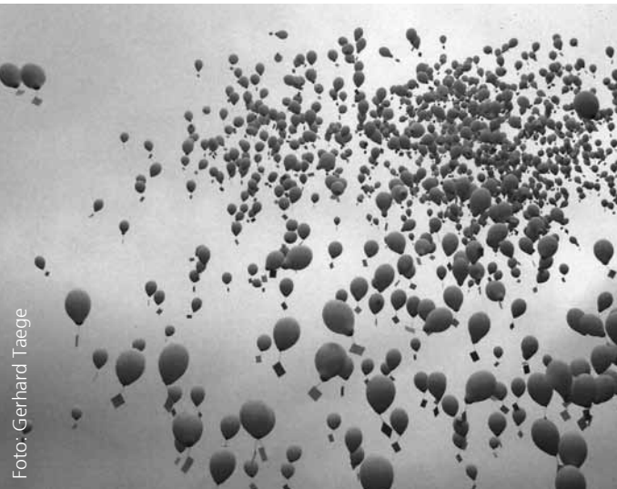
Ungewöhnliche Himmelserscheinung über Sachsenhausen. 1200 weiße Luftballons mit je zehn Namen von im Lager Umgekommenen flogen nach 60 Jahren in die Freiheit.

stiftung Aufarbeitung. Auf dem Kommandantenhof gedachten die Teilnehmer vor allem jener Menschen, deren Weg in den Massengräbern des Lagers endete. Knapp 12 000 sind bisher namentlich bekannt. Mit dem Flug von 1200 weißen Luftballons machten wir auf diese Schicksale aufmerksam und gaben den hier Umgekommenen symbolisch die Freiheit zurück, die ihnen im irdischen Leben verwehrt worden war. Es war ein bewegender Augenblick, als die Ballons nach kurzem Verharren dem Himmel entgegenschwebten.