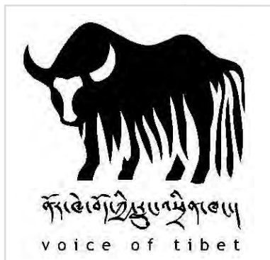
Emblem der „Stimme Tibets“.