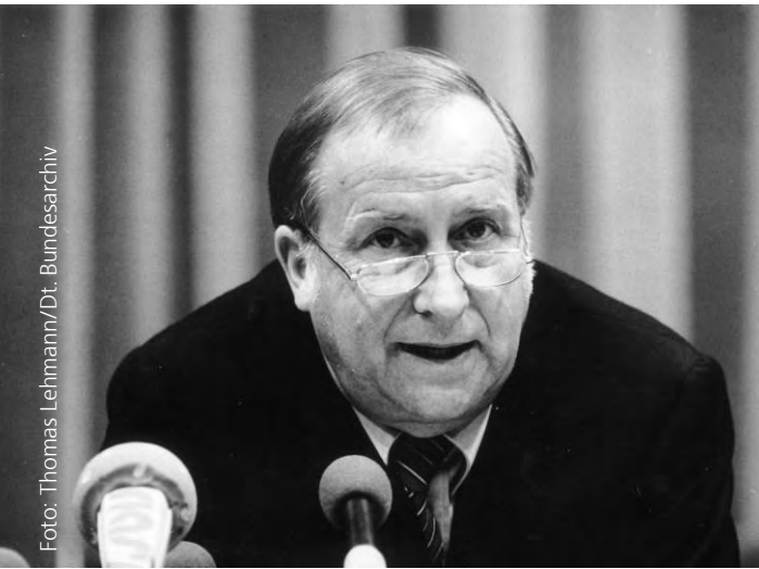
Detlev Rohwedder (1990).

Düsseldorf, 1. April 1991: Ostermontag, ein Tag mit frühlingshaften Temperaturen von etwa 13 Grad C, niederschlagsfrei. Der bedeckte Himmel vermittelt den Eindruck, als lege sich der Abend schneller als sonst über die Landeshauptstadt. Im Kaiser-Friedrich-Ring, Stadtteil Oberkassel, wie auch anderswo haben sich nach 23.00 Uhr die meisten Anwohner bereits zur Ruhe begeben. Nur vereinzelt sind noch Fenster beleuchtet.