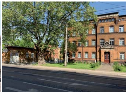
Verein Riebeckstraße 63 e.V. in Leipzig