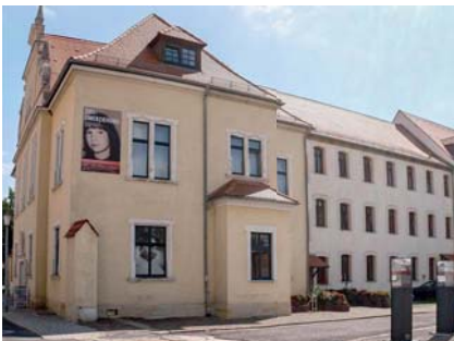
Gedenkstätte Geschlossener Jugendwerkhof Torgau

Seit 2021 besteht eine enge Zusammenarbeit zwischen den beiden Institutionen. Ein wesentlicher Grund dafür ist das vergangene Zusammenwirken der DDR-Einrichtungen, mit denen wir uns beschäftigen: die sich ähnelnden gewaltvollen Praktiken in den Geschlossenen Venerologischen Stationen und den Spezialheimen sowie die Tatsache, dass in den Biografien vieler minderjähriger Betroffener