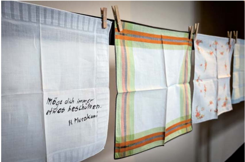
Präsentation einiger Taschentücher

Was für die eine Inspiration war und ist, ist und war für die andere, die in der Frauen- und Jugendhaftanstalt in Hohenleuben 1.000 Taschentücher täglich umsäumen musste, ein Fluch.