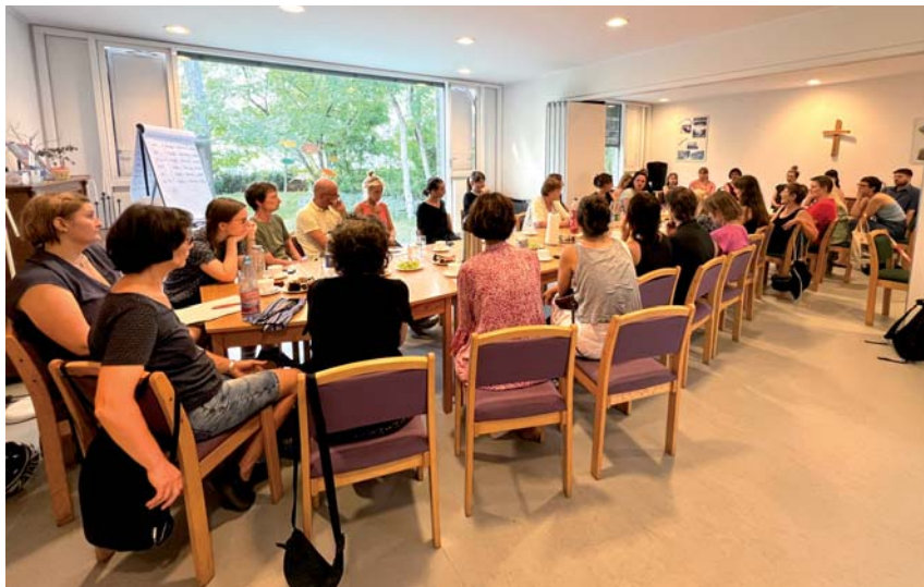
Erzählcafé in den Räumen der ev.-luth. Erlöserkirchgemeinde Leipzig-Thonberg auf dem Gelände der Riebeckstraße 63 am 17. August 2024.