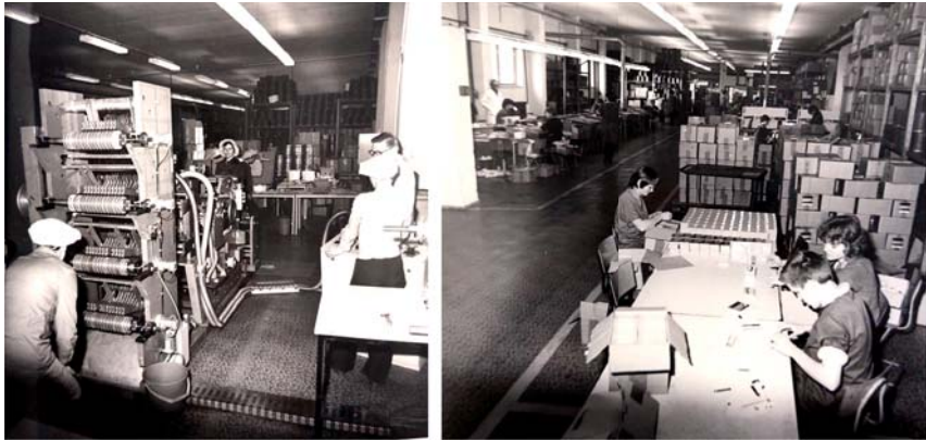
Haftzwangsarbeit im Arbeitsbereich Audioband, VEB Magnetbandfabrik Dessau