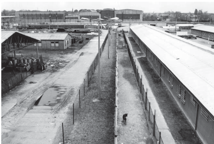
Links Produktionsgelände der Magnetbandfabrik, rechts ein Teil der für die Inhaftierung genutzten Baracken, BArch, MfS, BV Halle, AGL, Nr. 843, Teil 2.

die das Gelände zum abgeriegelten Haftkomplex machten. 8 Das Areal, von außen durch die Lage auf dem Gelände der Magnetbandfabrik kaum als Gefängnis Komplex zu erkennen, war zusätzlich zu den Wachposten durch eine massive Außenmauer mit Mauerkronensicherung, einem Sicherungszaun und dem durchgängigen Einsatz von Wachhunden gesichert (siehe Bild). 9