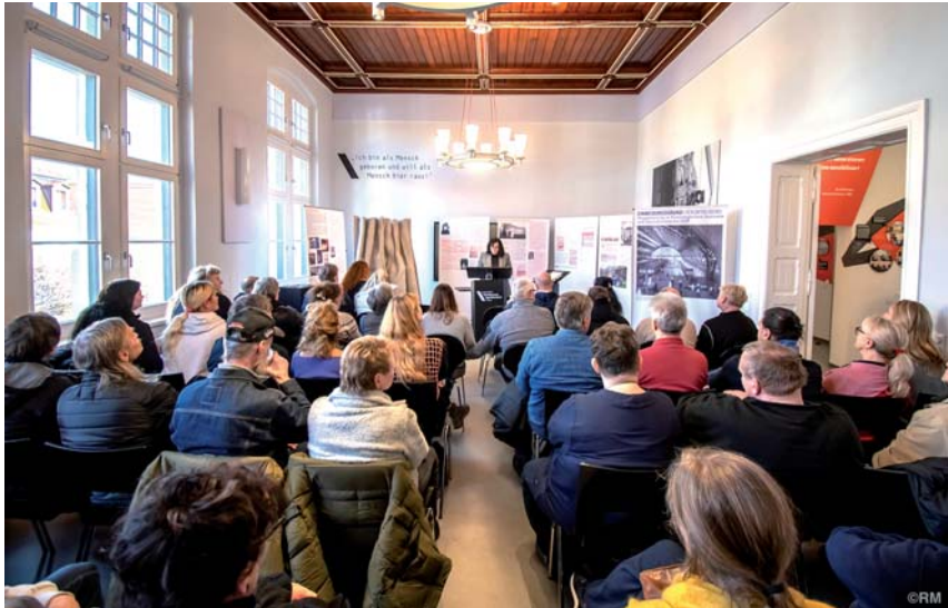
Wanderausstellung am 23. November 2024 in der Gedenkstätte Geschlossener Jugendwerkhof Torgau anlässlich des Treffens ehemaliger DDR-Heimkinder.

ten erforschte Standort einer ehemaligen Station. Die Ausstellung war im Ratshof zu sehen, also in unmittelbarer Nähe zur ehemaligen Poliklinik-Mitte. Dort, wo sich heute Wohnungen befinden, befand sich früher die Geschlossene Venerologische Station. Diese Station galt unter der Leitung von Gerd Münx als besonders restriktiv und gewaltvoll. Quellen belegen, dass eine Verlegung in die Station nach Halle als Strafmaßnahme verstanden wurde.