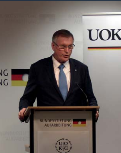
Johannes Singhammer, Vizepräsident des Deutschen Bundestages