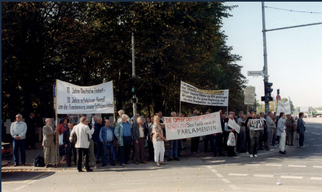
Demonstration am 29. September 2000 vor dem Reichstagsgebäude