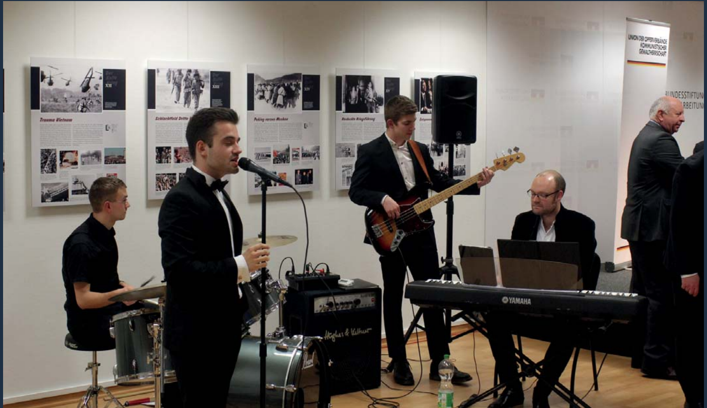
Für angenehme Stimmung sorgte „Cup Of Coffee“