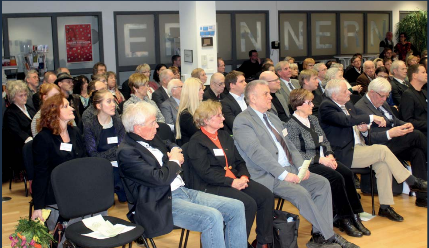
Festveranstaltung am 15. Februar 2017