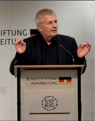
Roland Jahn, Der Bundesbeauftragte für die Unterlagen des Staatssicherheitsdienstes der ehemaligen DDR

Die Union der Opferverbände der kommunistischen Gewaltherrschaft gibt seit nunmehr 25 Jahren denen eine Stimme,