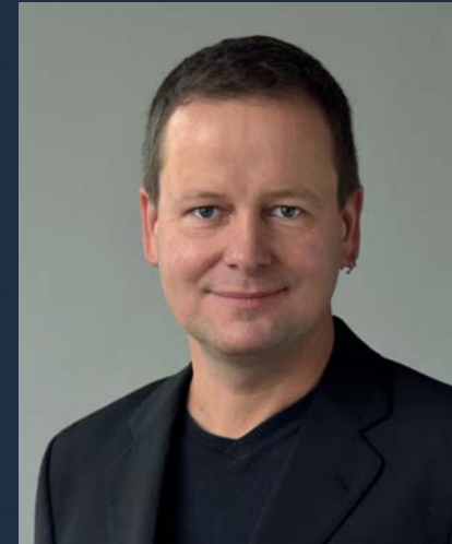
Dr. Klaus Lederer, Bürgermeister und Senator für Kultur und Europa von Berlin (Pressefoto)

Zu den 25 Jahren UOKG werden noch eine Reihe weiterer Jahre hinzukommen – denn, das vorweg, es kann keinen Schlusspunkt für die Aufarbeitung begangenen und erlittenen Unrechts unter der SED-Diktatur geben. Es darf ihn nicht geben. Die Orte der Täter und Opfer bleiben wichtiger Bestandteil der Erinnerungskultur, und es gilt sie weiterzuentwickeln. Die Schicksale und Erzählungen müssen bewahrt und ausgetauscht werden.