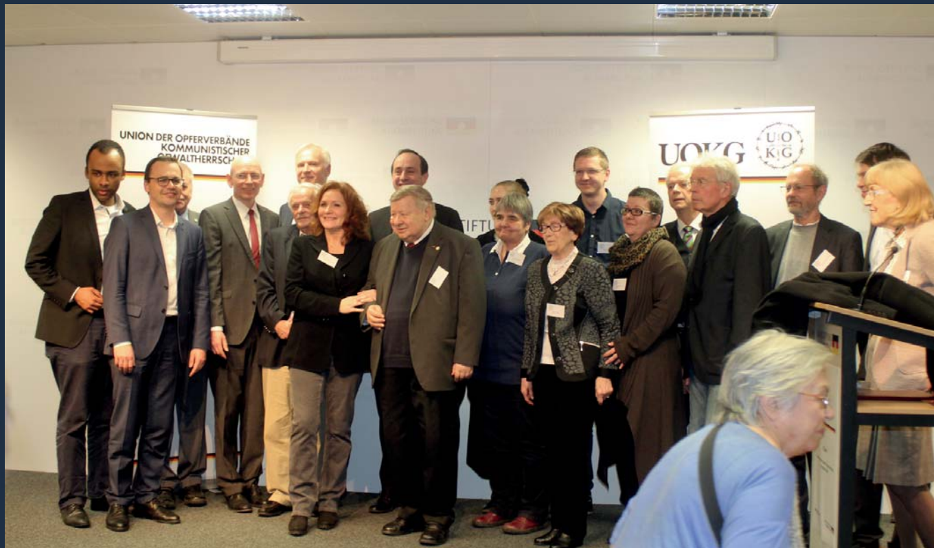
Vorstand und Mitarbeiter der UOKG