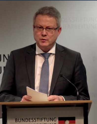
Ansgar Hollah, Die Beauftragte der Bundesregierung für Kultur und Medien, Gruppe K 4 „Geschichte und Erinnerung“