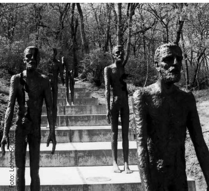
Abb. 1: Denkmal der Opfer des Kommunismus in Prag.

Nicht nur entscheidend, sondern die Wirkung unumkehrbar bestimmend ist die Art der künstlerischen Darstellung. Der Ort kann sich ändern, manche Denkmäler haben halbe Weltreisen hinter sich oder 50 Jahre in einer Scheune überdauert, die Gestaltung aber bleibt. Deshalb wird dieses Thema beim Berliner Mahnmal für die Opfer des Kommunismus sehr wahrscheinlich eine ganze Weile die Gemüter erhitzen. Da stellt sich zum Beispiel die Frage nach dem Abstraktionsgrad. Ein Findling ist abstrakt, ebenso eine Stele, eine Wand, eine Pyramide. Das muß kein Nachteil sein, verlangt dem Betrachter allerdings erst eine rationale „Übersetzung“ ab, um überhaupt emotional wirken zu können. Vielfalt und Möglichkeiten konkreter Darstellung sind unüberschaubar. Gelungene Beispiele sind das o.g. Prager Denkmal, aber auch das Mahnmal für die Opfer der kommunistischen Verbrechen im ukrainischen Lviv/Lemberg (Abb. 3). Außergewöhnlich sind Spannung und Dynamik dieser menschlichen Gestalt, die sich da bis an die Grenze des körperlich Möglichen gegen ein Gitter bäumt. Zwischen diesen beiden Arten der Darstellung liegen viele Mischformen. Besonders deutlich wird das bei der Skulptur Moloch Totalitarismus in Sankt Petersburg (Abb. 4). Der Mensch als konkretes Wesen hängt erschlaft und gebrochen in