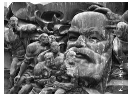
Marx-Relief (Ausschnitt): Je größer der Kopf, desto besser der Inhalt?

An diese wieder gewonnene Freiheit sollte die Universität erinnern und an ihre Jahrhunderte herausragende Rolle in der deutschen Geistesgeschichte anknüpfen. Die Wiedererrichtung der Roßbachfassade als Freiheits- und Einheitsdenkmal wäre ein glaubwürdiger Schritt.