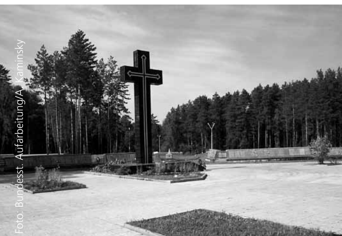
Abb. 2: Gedenkstätte für die Opfer der politischen Repression 1930-1950 in Jekaterinburg.