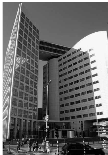
Gebäude des Internationalen Strafgerichtshofes in Den Haag.

Für den Menschenrechtsschutz im Allgemeinen hat der renommierte Völkerrechtler und IGH-Richter Bürgenthal das folgende schöne Bild gefunden: „Auch heute noch sind viele Teile der Welt von den Segnungen des internationalen Menschenrechtsschutzes ausgeschlossen. Ich vergleiche diese Situation mit mittelalterlichen Weltkarten, die viele leere, meist weiße Flächen von ‚terra incognita‘ aufwiesen. Auf der Landkarte des internationalen Rechts gibt es heute noch zu viele terrae incognitae, aber: die weißen Flächen werden langsam kleiner.“