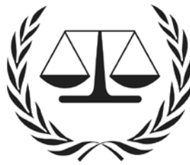
Das Emblem des Internationalen Strafgerichtshofes.

der Parteien vorbereitet und vom Parlament fast einstimmig verabschiedet. So demonstrierte Deutschland eindrucksvoll, daß es seine Lektionen gelernt und das Vermächtnis von Leipzig und Nürnberg erfüllt hatte.