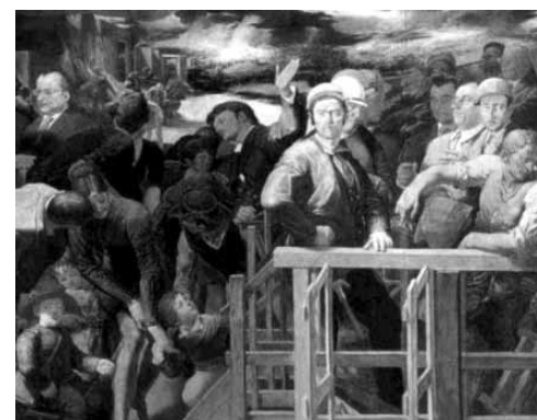
Ausschnitt des Gemäldes von W. Tübke. Die Galerie der Täter auf dem Gerüst rechts.