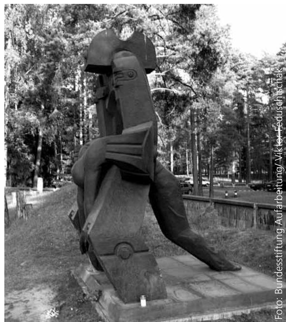
Abb. 4: „Moloch Totalitarismus“ in St. Petersburg.

Dokumentationen auf der Internetseite www.stiftung-aufarbeitung.de zum Herunterladen: