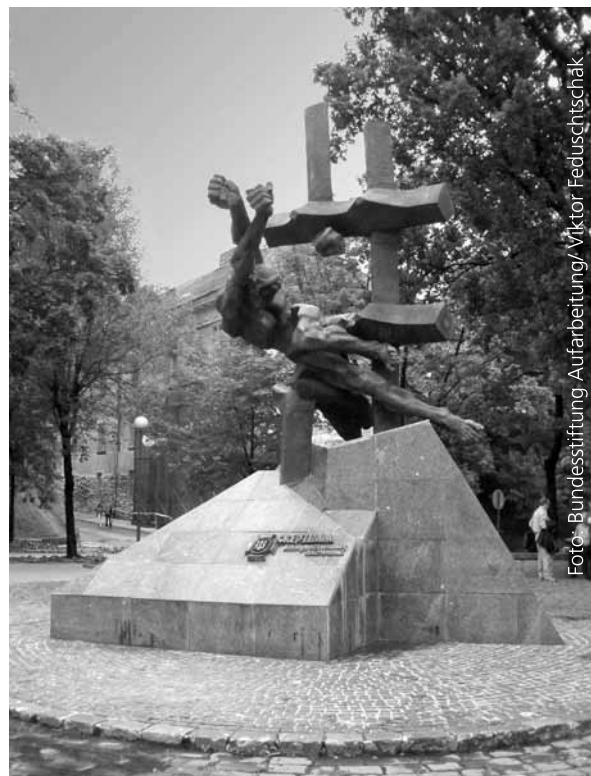
Abb. 3: Mahnmal für die Opfer kommunistischer Verbrechen in Lviv/Lemberg.