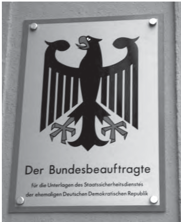
Noch bezeichnet das Schild die Orte, an denen die Stasi-Akten aufbewahrt werden.

Die Union der Opferverbände kommunistischer Gewaltherrschaft (UOKG) begrüßt die Einsetzung einer Expertenkommission zur Zukunft der Behörde des Bundesbeauftragten für die Unterlagen des Staatssicherheitsdienstes der ehemaligen Deutschen Demokratischen Republik (BStU).