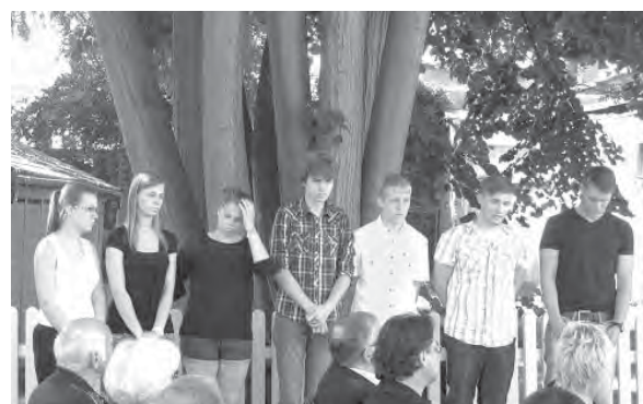
Schüler der Fleesensee-Schule gestalteten die Gedenkfeier mit.