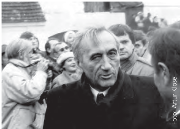
Tadeusz Mazowiecki im November 1989.

Berlin ist eine Stadt des Kampfes um die Freiheit. Die Berliner Mauer war ein Symbol für Unfreiheit und Unterdrückung. Der Tag, als die Mauer fiel, war ein glücklicher Moment in meinem Leben. Noch glücklicher war ich jedoch, als wenige Wochen vorher, im Oktober 1989, in Leipzig und