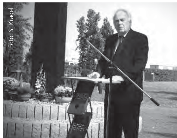
Wolfgang Böhmer während seiner Rede in Mühlberg.

Die Veranstaltung wurde feierlich fortgesetzt mit einem ökumenischen Gottesdienst. Danach versammelte man sich am Hochkreuz, wo Prof. Dr. Wolfgang Böhmer, ehemaliger Ministerpräsident von Sachsen-Anhalt, mit warmen Worten seine Empfindungen ausdrückte. Er hatte sich